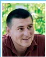
BAGLYAS GYÖRGY szociálpolitikus és agykontrolltató